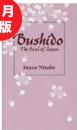
188 ページ ペーパーバック 182 x 110mm